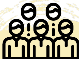
會員制 / 支援小組

SI CLUB 應由不少於 4 名學生組成幹事會。幹事會成員主要管理和安排日常運作，計劃和宣傳活動，以支援 SI CLUB 的工作。幹事會可安排合適職位，各司其職。一般而言，幹事會不得多於 10 位成員。